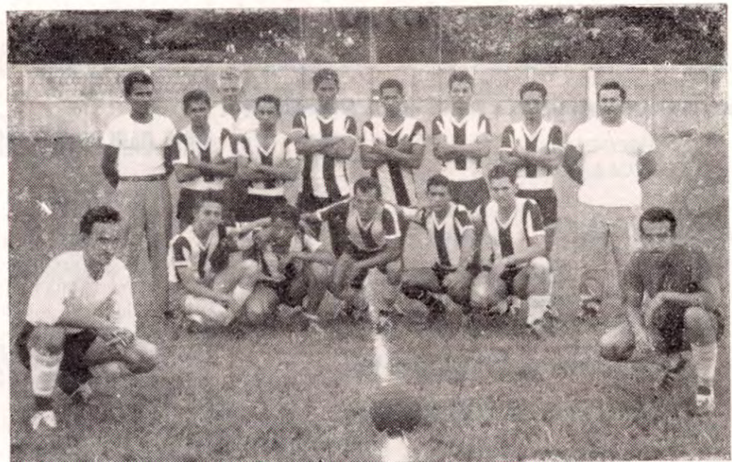
Equipo del Asturias F. C., de Puntarenas cuando sus mejores tiempos.

La década del 20 al 30 fue pródiga en acontecimientos de-